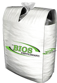
Big Bag Kg. 500