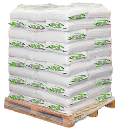
Pallet Kg. 1.500 | Pz. 60 x Kg. 25 Kg. 1.500 | Pz. 50 x Kg. 30