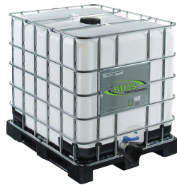
Tanicone Kg. 1.100 - 1.250